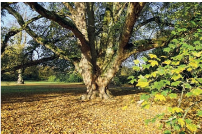
Impressionen aus dem Hirschpark im Wandel der Jahreszeiten