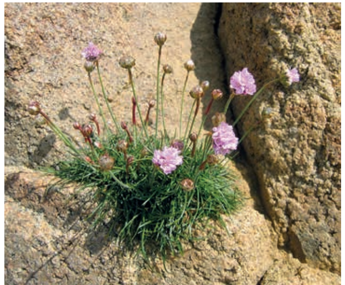
Die Strandnelke ( Armeria maritima ), Blume des Jahres 2024, kommt gut mit trockenen und salzigen Böden zurecht.

am 14. Juni: 10-12 Uhr; 15. & 16. Juni: 10-16 Uhr.