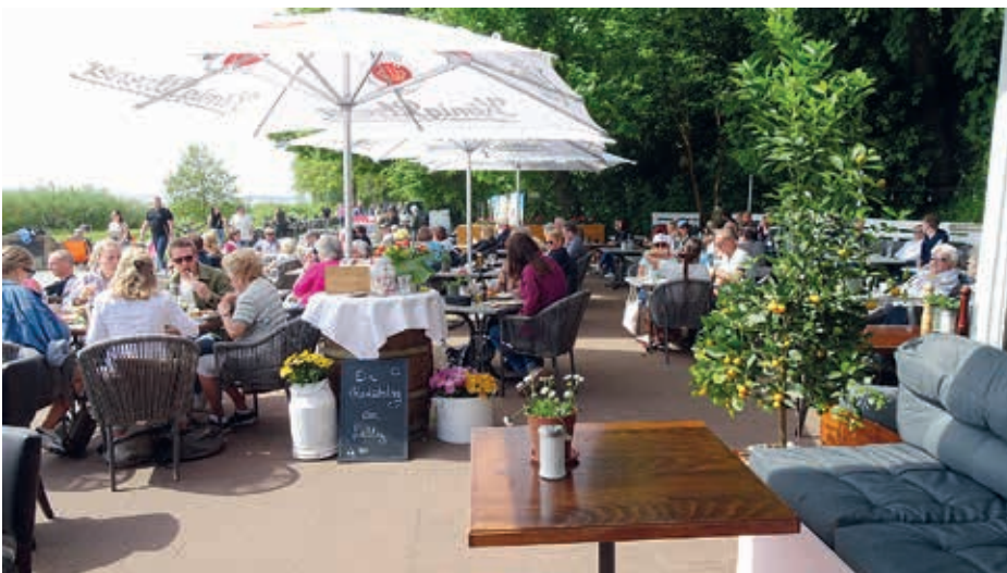
Bei schönem Wetter ist es nicht einfach noch einen Platz zu ergattern