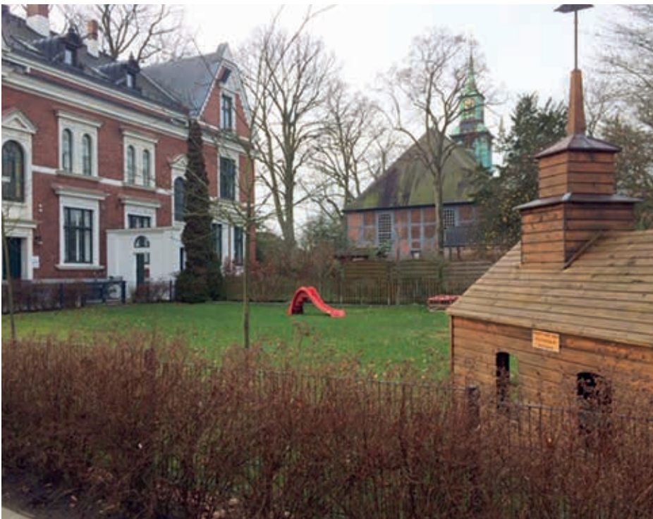
Das Pastorat von der Nordseite

Der Vollständigkeit wegen, darf nicht unerwähnt bleiben, dass man sich seit den 30er Jahren bereits Gedanken gemacht hatte, wie man die noch verbliebene Gemeinde von Klein Flottbek geistlich versorgen könnte. So führte man im Saal des Konservatoriums am Hoch-