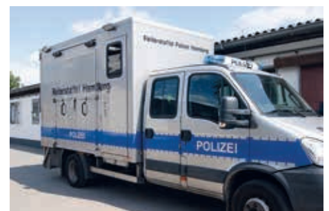
Transportfahrzeug für die Pferde