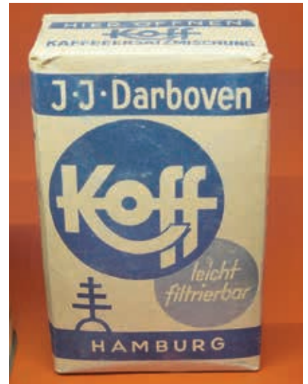
J.J. Darboven, Kaffeersatzmischung aus dem 2. Weltkrieg

Habs liegt keinesfalls falsch damit, dass der ständige Genuß von Zichorienkaffee den Zunge und Magen ruinieren konnte: Denn dessen Geschmack wurde damals oft noch weiter verschlechtert - durch allerlei Zutaten, die rein gar darin nichts zu suchen hatten. Schließlich konnte