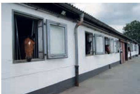
Die Pferde in ihrer Unterkunft

Stehen Einsätze an, bei denen Ausschreitungen zu befürchten sind, wiegt die dann erforderliche Zusatzausrüstung, inklusive Helm, 15 kg. Auch den Pferden werden dann aus Sicherheitsgründen Au-