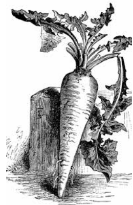
Chicorée à grosse racine de Bruns

Auch wir Zweibeiner nutzen die Zichorie seit langem. Die jungen, leicht bitteren Blätter aßen schon die Römer, sie kannten zudem ihre appetitanregende und verdauungsfördernde Wirkung, die auf Bitterstoffe zurückgeht. Angeblich soll sie auch beruhigend wirken, doch hier steht ein Beweis noch aus. Immerhin wurde die Wegwarte zur Heilpflanze des Jahres 2020 erkoren.