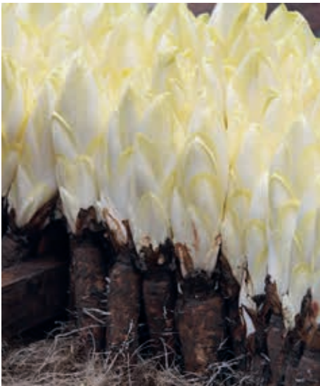
So wird Chicorée erzeugt (Wikipedia)

Als Salat sind Zichorienblätter noch heute beliebt, allerdings haben sie mit den kleinen grünen Blättern der meist staubbedeckten Exemplare am Wegesrand keinerlei Ähnlichkeit mehr. Wer würde die steife Wegwarte schon mit dem zarten hellgelben Chicorée in Verbindung bringen? Um diesen Zichorien-Salat zu erzeugen, treiben Gartenbaubetriebe im Winter die Wurzeln von Kulturzichorien im Dunkeln an. Italienische Gärtner peppten das Bleichgemüse ein wenig auf und züchteten eine rote Zichorie, den Radicchio.