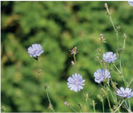
Zichorie ganz

So manch ein Straßenrand in Nienstedten wird vom Hochsommer bis in den Frühherbst hinein von einer Pflanze mit hübschen hellblauen Blüten verschönert, der Gewöhnlichen Wegwarte ( Cichorium intybus ) oder Zichorie. Auch wenn die Sonne auf den Asphalt brennt, kann ihr Trockenheit nichts anhaben, denn ihre Wurzeln reichen tief ins Erdreich. Wird die Hitze gar zu groß, beugt sie allzu hohen Flüssigkeitsverlusten vor, indem sie ihre Blätter abwirft. Das verringert große Verdunstungsflächen. Die lebenswichtige Photo-