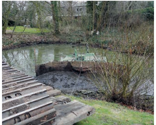
Schlamm über Schlamm