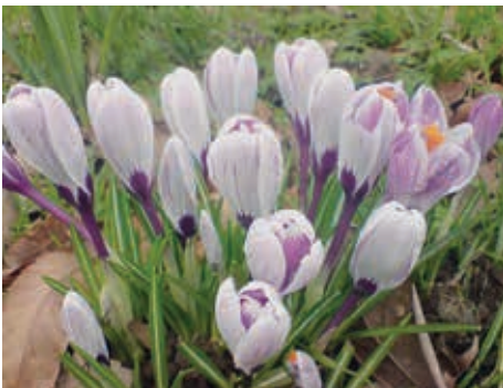
Asparagus Crocus Vernus (Wikipedia)

Eine besonders üppige Krokuswiese kann man übrigens im Husumer Schloßpark bewundern. Jedes Jahr im März erblühen dort Millionen zartvioletter Kelche. Wer keine Zeit hat, den Krokussen in der „Grauen Stadt am Meer“ einen Besuch abzustatten, geht einfach zu ihren Verwandten im Klein Flottbeker Botanischen Garten. Vor seiner Eröffnung im Jahre 1979 spendierten die Husumer der hiesigen Gartenverwaltung zahlreiche Zwiebelchen von ihrer Krokuswiese.