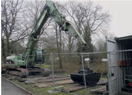
Eine Woche lang waren die Großgeräte im Einsatz

Es ist noch gar nicht so lange her, dass die Nienstedtener sich freuten, dass die kleine Grünanlage mit Teich am Hermann-Renner-Stieg wieder hergerichtet wurde. Um so größer war die Irritation, als wieder Großgerät aufgefahren wurde. Bag-