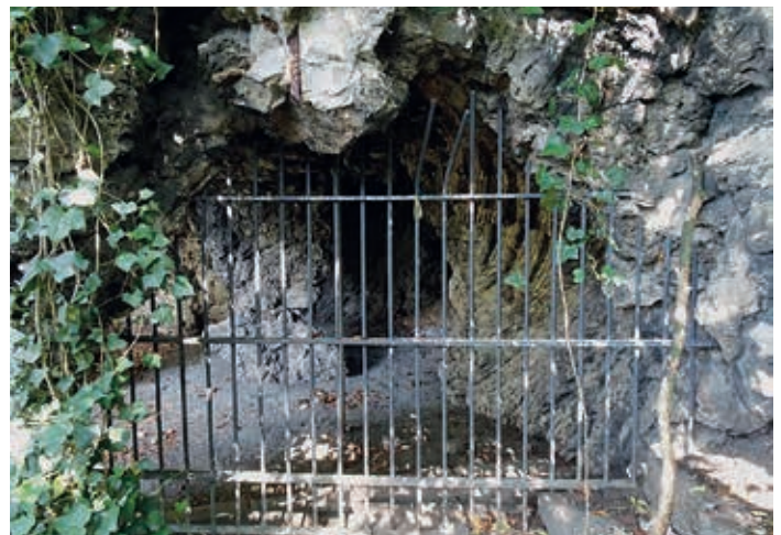
Die Grotte hinter Gittern