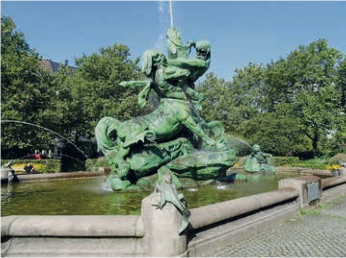
Der Stuhlmann-Brunnen von 1900

nämlich keinen Wasserkreislauf, alles floss in die Kanalisation beziehungsweise die Elbe. Gleiches galt für zwei weitere Springbrunnen am Kaiserplatz, dem späteren Adolf-Hitler-Platz, der vor und nach dem Dritten Reich Platz der Republik hieß. Die sparsamen Altonaer ließen das Wasser also nur zu bestimmten Uhrzeiten fließen und dachten sich dann, dass man mit dem Abwasser doch noch mehr anfangen könnte. „Also wurden Leitungen zum Altonaer Balkon verlegt, um mit dem Wasserfall eine Touristenattraktion zu schaffen,“ sagt Frau Abramowski. Der Elbhäng war schon seit dem 18. Jahrhundert ein beliebtes Ausflugsziel und zeitweise in ganz Europa berühmt, weil der Franzose Cesar de Rainville (1767-1845) dort ab 1798 ein