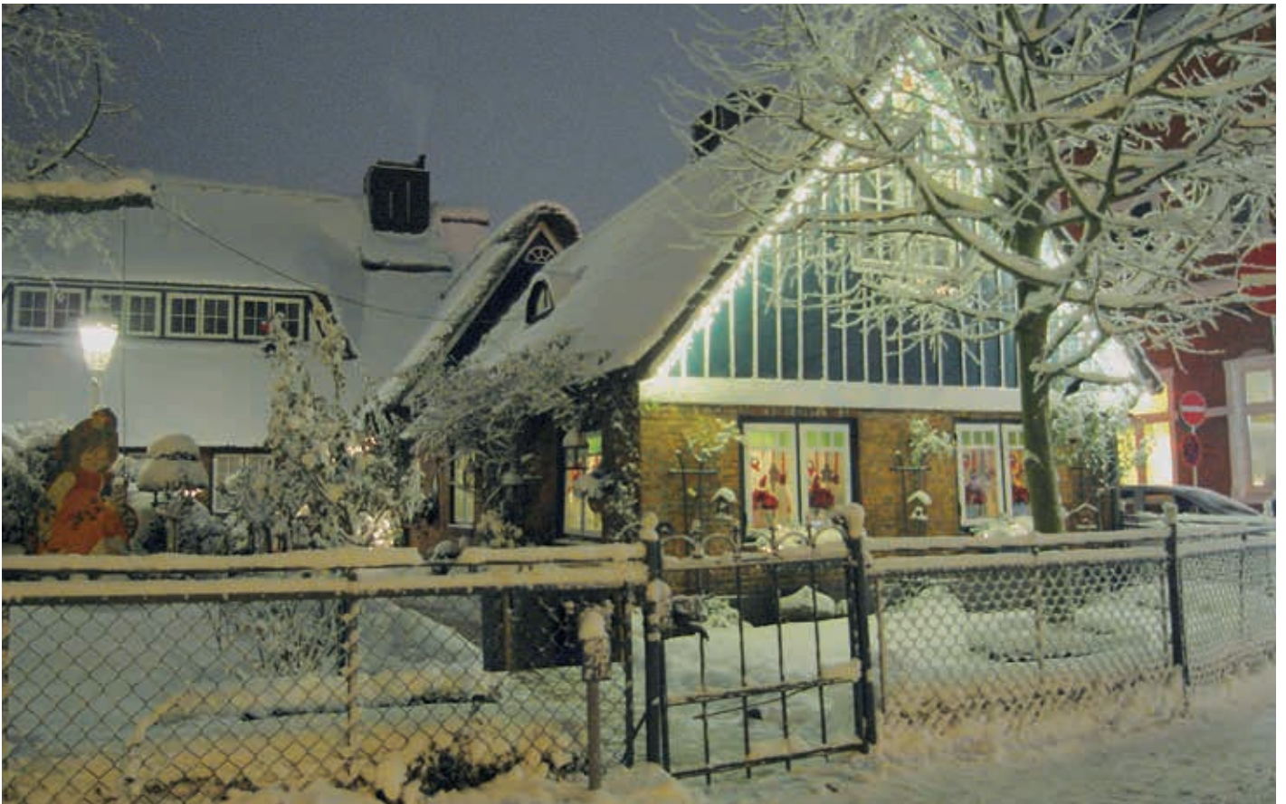
Das Ladiges-Haus in „Winterkleid“