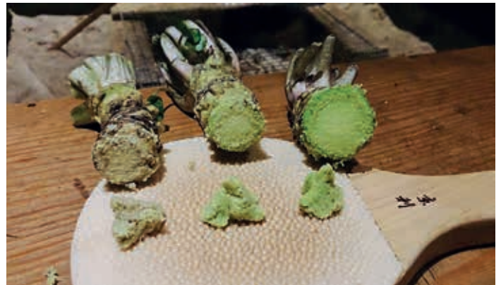
Wasabi-Knollen angeschnitten

für die verschiedenen Zutaten gebildet. Möchte man mehr Wasabi, verlangt man nach namida – Tränen. Auch wenn einem die Schärfe den Atem nimmt, der Sauerstoff in der Luft geht den Scharfstoffen bald an den Kragen. Traut man sich an den Wasabi-Klecks neben den Sushi-Häppchen nicht heran, hat er nach einer Viertelstunde viel von seiner Schärfe verloren.