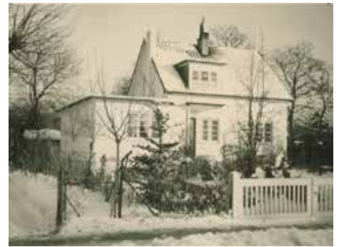
Bild 4. 1935 ist ein schmuckes Häuschen daraus geworden. Hinter dem Haus ist die ehemalige Kegelbahn zu erkennen, die noch lange den in das ehemalige Hotel eingewiesenen Bewohnern Abstellräume bot.

Doch den Ersten Weltkrieg und die schwere Zeit danach hat das Etablissement nicht überlebt.