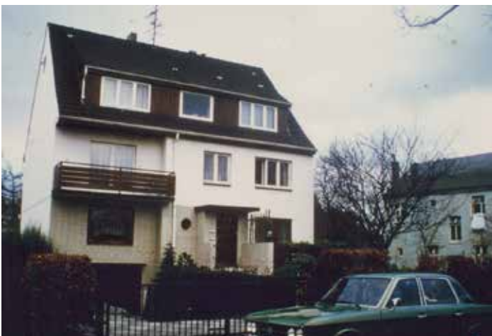
Bild 7. Um 1960. Bis zu 17 Personen wohnten zeitweise in dem rangewachsenen, aber noch nicht ausgewachsenen Haus. Rechts die Rückseite des ehemals feinen Hotels mit Notwohnungen. Der Ballsaal ging bis zur Mitte des Hauses.

Sieberlings Ballsaal ist Geschichte (Holthusen's und der Elbschloss-Saal auch). Das kleine Doppelhaus nebenan wird z. Zt. entkernt und hinter den alten Mauern unter strengen Auflagen zu einem modernen Einfamilienhaus umgebaut (Bild 1 links). Als das Haus Nr. 14 wuchs, spielte Milieuschutz keine Rolle, Wohnraum zu schaffen war das Gebot der Stunde. In den 60/70er Jahren folgte die Infrastruktur. Alles Ältere und in schweren Zeiten unansehnlich Gewordene sollte zugunsten einer zügigen Verkehrsführung verschwinden, auch Ladiges' und Koopmanns Reetdachhäuser sowie das (inzwischen sehr viel schlichter gewordene) Jugendstilhaus am Marktplatz. Ein riesiges Ladenzentrum und Park- und Busplätze waren dort geplant, einheitlich der ganze Stadtteil in Gelbklinkern – aber das ist eine andere Geschichte. Heute steht der Milieuschutz im Vordergrund, der unser Dorf so wohnlich (und teuer) erhält. Und abermals Wohnraum – doch das ist noch eine andere Geschichte.