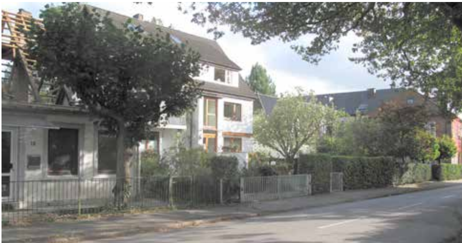
Bild 1. Sieberlingstraße 14 zwischen dem kleinen Doppelhaus 16/18 (z. Zt. milieugerecht für eine Familie umgebaut und erweitert) und dem großen, ehemaligen Gasthaus „Zur Doppeleiche“, Nr. 10 bis 12 (seit 1988 privates Alten- und Pflegeheim „Haus Sieberling“).

Bild 2. Um die vorvorige Jahrhundertwende tanzte hier der Bär. Rechts daneben erstreckte sich die Kegelbahn, links an der damaligen Marktstraße lag der „Ausspann“: Pferdestall und Kutschenremise.