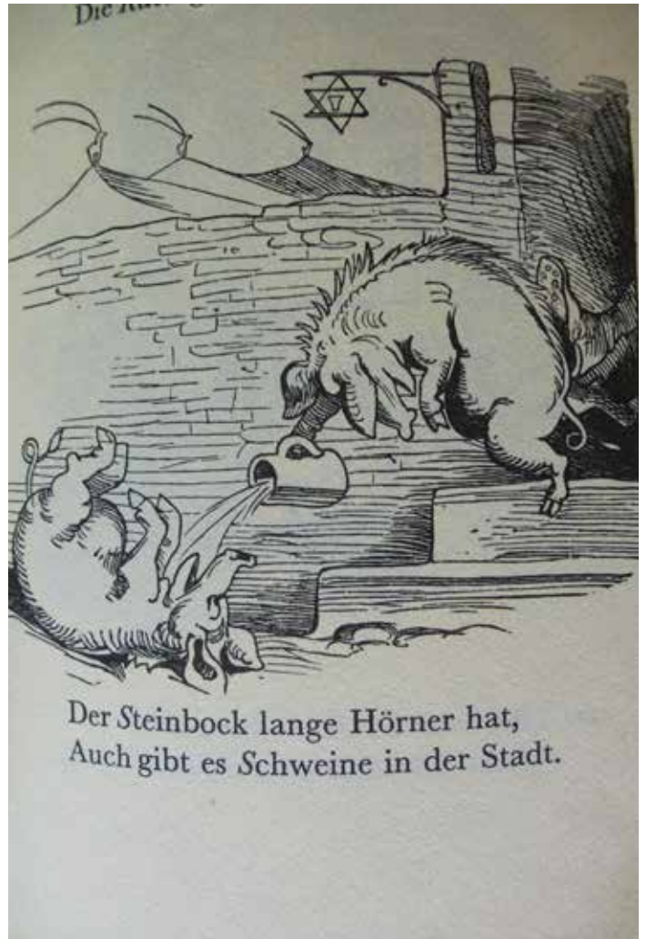
Ein Bierstern von Wilhelm Busch