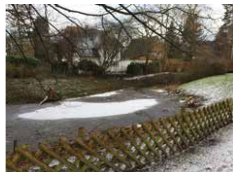
... und so Anfang Februar

Durch Zurückschneiden der Bäumchen und Sträucher sowie durch Entfernen der umgestürzten Bäume ist der Teich wieder ansehnlich ge-