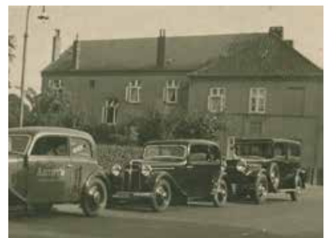
Bild 5. Wo früher am Straßenrand Ausspann und Remise für die Kutschen der Hotelgäste standen und dahinter der Ballsaal, präsentierte sich jetzt die Flotte des Fabrikanten von Klebstoffen („Artefix“, sh. vorderes Auto) aus der Garage des Hauses Nr. 14, wundervolle Vorkriegsmodelle!

1932 kaufte es Wilhelm Sothmann von der Stadt Altona, in deren Besitz das heruntergekommene Hotelgrundstück inzwischen gelangt war und die es teilte. 1935 baute der neue Eigentümer links eine Garage an mit Wohnräumen darüber, denn die Familie war größer geworden (Bild 4).