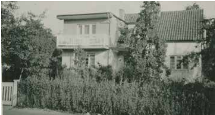
Bild 6. 1948. Das mit Trümmersteinen aufgestockte Haus. Es bot mehr Wohnraum, hatte aber seinen Charme verloren, auf den es damals allerdings auch nicht ankam.

Die D-Mark kam, die Lebensmittelkarten blieben noch lange und die Wohnungsnot auch. Sie zu verringern gab es allmählich wieder richtiges Baumaterial, was sich auf den Baustil des Hauses günstig auswirkte (Bild 7). Auch die Autos wurden größer. Das endgültige Aussehen gab dem Haus 2002 der Sohn des Gründers, der schon als Schüler seinem Vater nach dem Krieg kräftig beim Wachsen des Hauses geholfen hatte (Bild 8).