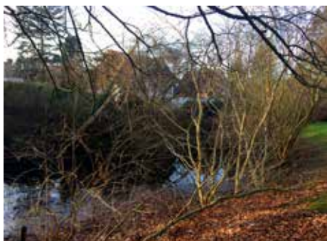
So sah der Teich noch im Januar aus ...

„Was lange währt, wird endlich gut“, meinte kurz vor Christi Geburt der römische Dichter OVID.