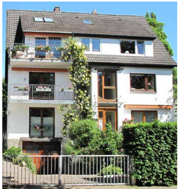
Bild 8. Zwischen den beiden „alten“ Gebäuden fügt es sich das neue heute als „modernes“ Dreifamilienhaus mit seiner gegliederten Front in prächtigem Rosenschmuck harmonisch ein.