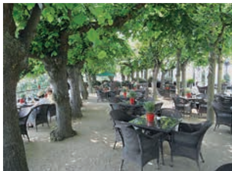
Die Lindenterrasse: Ein beliebtes Ausflugsziel im Sommer