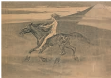
Ernst Barlach, Heideritt, 1896 Kohle und Bleistift auf Zeichenpapier Ernst Barlach Haus Hamburg

Auch wenn sich der norddeutsche Bildhauer Ernst Barlach (1870-1938) und österreichische Zeichner Alfred Kubin (1877-1950) nie begegnet sind, schätzten sie einander sehr. Beide verband die künstlerische Suche nach der einfachen Form beide schätzten das Zeichnen als intensives, gleichsam seismographisches Verfahren, um