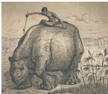
Alfred Kubin, Dickhäuter, um 1898/99 Federe und Tusche, laviert auf Karton Oberösterreichisches Landesmuseum Linz

vom Individuellen zum Überindividuellen vorzudringen, zu dem, was Barlach das „Rätselwesen“ Mensch nannte. Dabei offenbart die Gegenüberstellung ihrer Zeichnungen über stilistische Berührungspunkte hinaus eine grundlegende geistige Verwandtschaft: Barlach wie Kubin waren gleichermaßen fasziniert