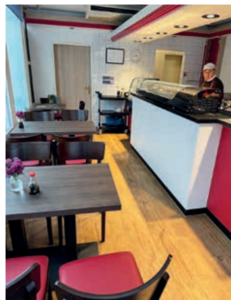
Ein lichtdurchflutendes Ambiente

Alle Gerichte werden frisch zubereitet in hervorragender Qualität. Wir wünschen Herrn Basnet viel Er-