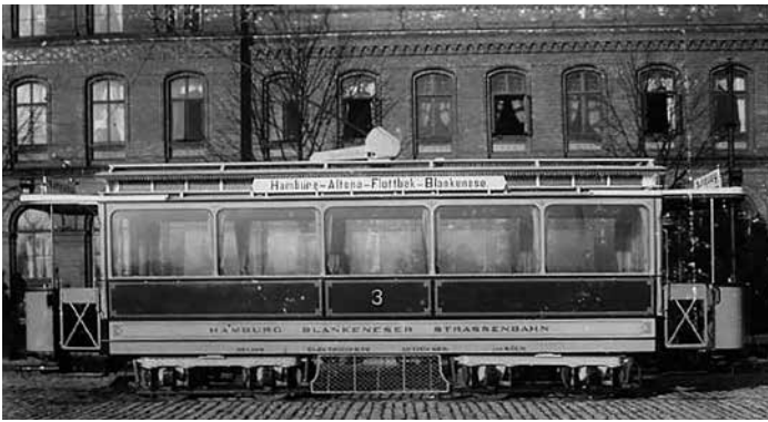
Vierachsiger Triebwagen 3 der „Elektrischen Straßenbahn Hamburg-Blankenese“. [Foto der Wagenbauanstalt Falkenried vermutlich von 1899] Mit solchen vierachsigen Triebwagen wurde Mitte Dezember 1899 der Betrieb aufgenommen. Die Wagenbauanstalt Falkenried hatte die Triebwagen 1899 gebaut.

derten den Anschluß an die Bahn. Die Eröffnung der Strecke Blankenese-Wedel erfolgte daher in verhältnismäßig kurzem Zeitabstand, nämlich am 1.12.1883. Leider versäumten die für den Bau Verantwortlichen, die Strecke von Blankenese in gerader Linie weiterzuführen. So entstand der Blankeneser Kopfbahnhof mit seinen noch heute bestehenden Anlagen und der großen Schleife nach Sülldorf.