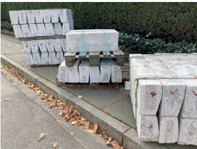
Neue hellgraue kantige, gesägte Granitborde

eins zu eins übernommen, ohne Rücksicht auf die besondere kulturelle und landschaftliche Bedeutung der Elbchaussee. So wurden an vielen Stellen die alten Bordsteine aus behauenen dunklem Granit ausgebaut und durch gesägten hellgrauen Stein oder sogar durch Klebebordstein aus Beton ersetzt. Der Zusammenhang des historisch landschaftlichen Straßenraums der Elbchaussee wurde zerstört. Diese Kritik mag für Manchen kleinkariert oder gestrig erscheinen. Aber oft ist es eine Vielzahl von kleinen Missgriffen, die das gesamte Bild zerstören können. Die Elbchaussee gilt immer noch als eine der schönsten Straßen der Welt. Deshalb können bei baulichen Eingriffen nicht nur technische und funktionale Regeln gelten, sondern auch die Vorgaben der Straßenraumgestaltung. Landschafts-, Ensemble- und Denkmalschutz müssen bei der Planung und der Durchführung stets beachtet werden.