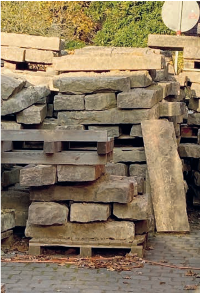
Historische Bordsteine aus dunklem braunrotem behauenen Granit