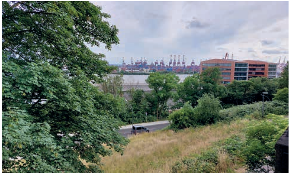
Der durch die Columbia Towers eingeschränkte Blick auf den Hafen

Der neue Bebauungsplan Altona-Altstadt 56 „Areal West“ Fischereihafen hat in der Öffentlichkeit viel Kritik hervorgerufen. Nach diesem Plan soll der Bereich, östlich begrenzt durch die Bebauung am Elberg Campus und westlich durch die 38 m hohen Columbia Towers, eine neue durchmischte Nutzungsstruktur erhalten. Zentraler Baustein soll eine multifunktionale Markthalle sein, ergänzt durch Neubauten für Dienstleistungen, gewerbliche Nutzungen und Wohnbebauung. Anstoß der heftigen Kritik ist die geplante Höhe der Gebäude.