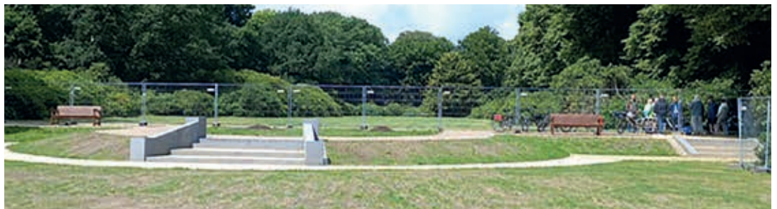
Noch ist die Neugestaltung der Lindenterrasse nicht vollendet