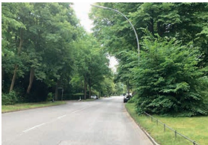
Elbchaussee, heutige historisch landschaftliche Gestaltung (2. Bauabschnitt)

Bei der direkten Übertragung des Konzeptes auf die Elbchaussee wurde offensichtlich auch der Materialmix