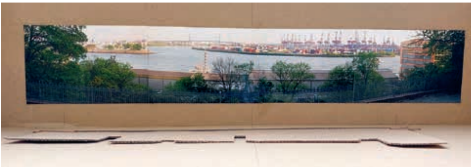
Modell 1: Das ist der heutige Blick auf die Elbe und den Hafen

des Hamburger Westens fordern das Bezirksamt Altona, die Stadtplanung, die Kulturbehörde und die Landschaftsplanung auf, die vorhandenen Höhen der Lagergebäude einzuhalten, damit nicht die gleiche Fehlentwicklung passiert, wie bei den 2009 errichteten Columbia Towers, die eine der schönsten Blickbeziehungen auf den Landschaftsraum Elbe zerstört hat. „Das vorgesehen, neue Gebäude direkt neben den Columbia Towers, der sogenannte Kaispeicher, würde die Entwicklung fortsetzen und den Aussichtspunkt vom Heine Park auf die Elbe komplett überflüssig machen.“