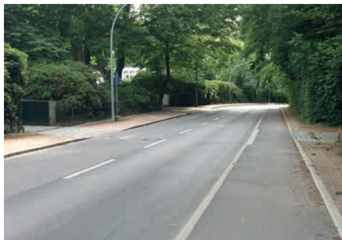
Optische Teilung des Straßenraums durch neuen Radweg (1. Bauabschnitt) Beton versus Granit