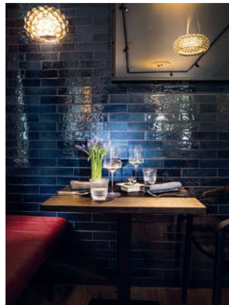
Der gedeckte Tisch

Für Reservierungen: Tel. 040 537 519 21 Info@Felix-Restaurant.Com www.felix-restaurant.com