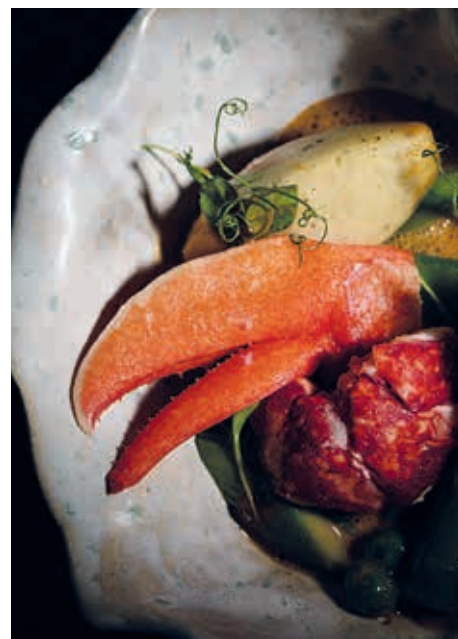
Sieht das nicht lecker aus?