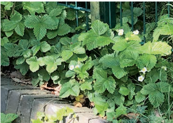
Gartenerdbeere in Nienstedten

Doch diese Hoffnung sollte sich nicht erfüllen, da Frézier nur weibliche Pflanzen der Chile-Erdbeere ( Fragaria chiloensis ) erwischt hatte. Also musste man sich in Europa weiterhin mit den kleinen heimischen Wald-Erdbeeren begnügen, die ja in Gartenbaubetrieben durchaus in größerem Maßstab angebaut wurden – vor allem um Paris. Doch dann brachte Mitte des 18.