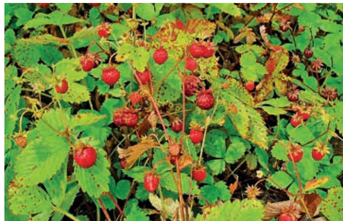
Fragaria vesca , die Walderdbeere