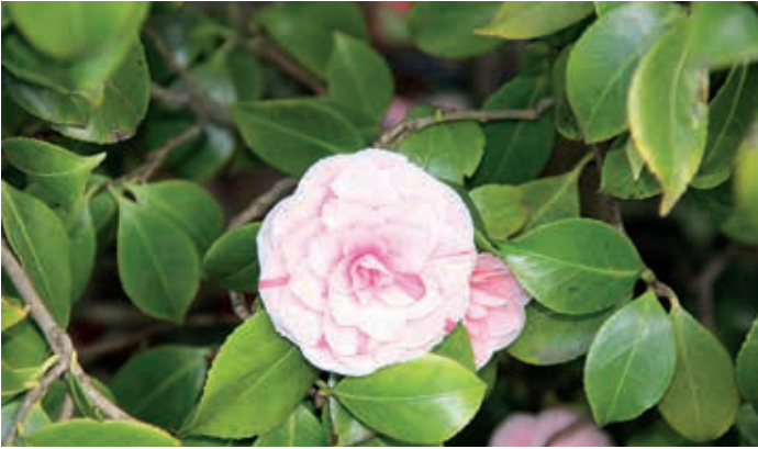
Über 2.000 Sorten in vielen unterschiedlichen Farben existieren, hier eine rosa blühende

strauch (Camellia sinensis) wirkt wie ihr Doppelgänger. Während aber die Urform der Camellia japonica rote Blüten hat, sind die des Teestrauchs stets weiß. (s. Abb.) Die Pflanzenfamilie zeichnet sich durch eine