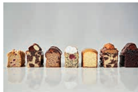
Schauen sie nicht verführerisch aus?

Mit ihren süßen, aber auch dekorativen Kreationen hat sie sich schon in viele Herzen der Marktbesucher „gebacken“. Vom kleinen Präsent bis zum umfänglichen Catering, kann man sie übrigens auch zusammen mit ihrem Verkaufswagen für das