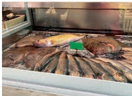
Eine breite Auswahl an Fischen wie z. B.: Bachforellen aus der Lüneburger Heide wird angeboten