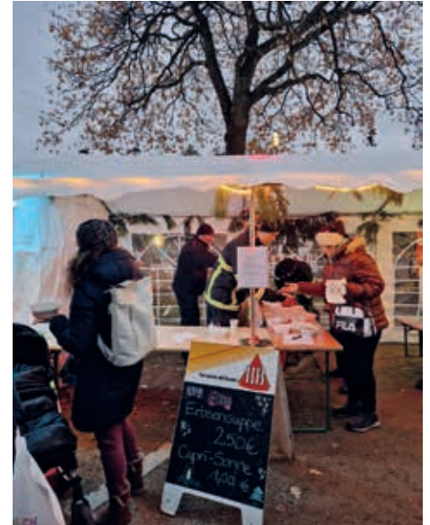
Und die berühmte Erbsensuppe unserer Freiwilligen Feuer fand großen Zuspruch

Um 18.00 Uhr war der Weihnachtsmarkt zu Ende und das Gospelkonzert