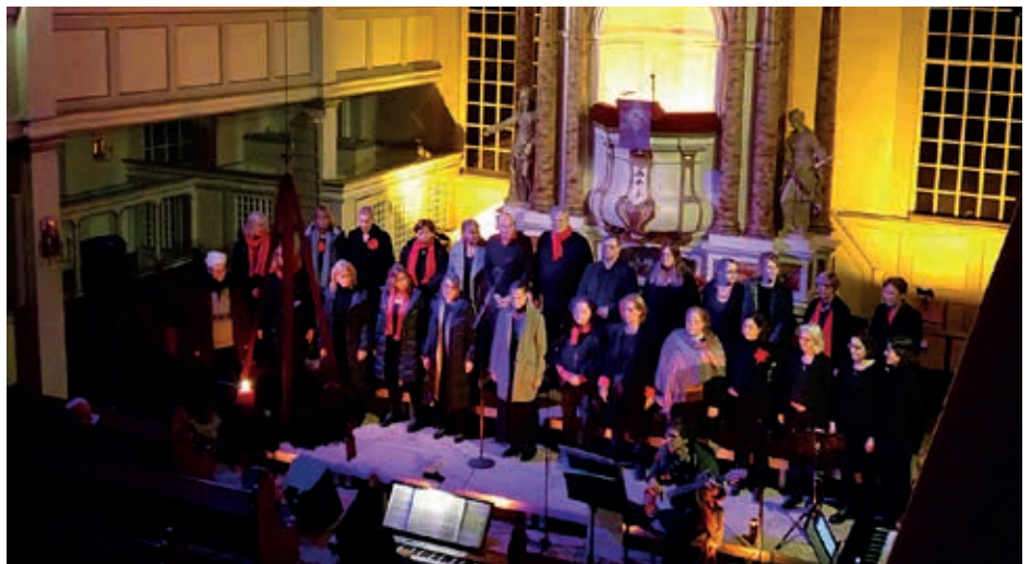
Den krönenden Abschluss bildete das Gospelkonzert in der Kirche.