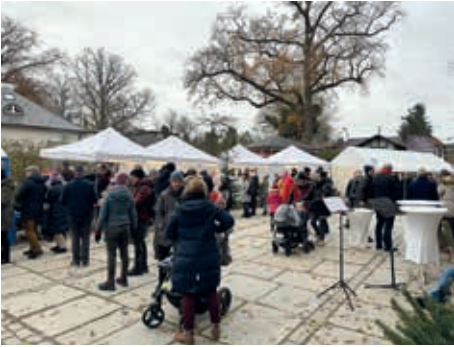
Schon früh kamen die ersten Besucher zum Markt