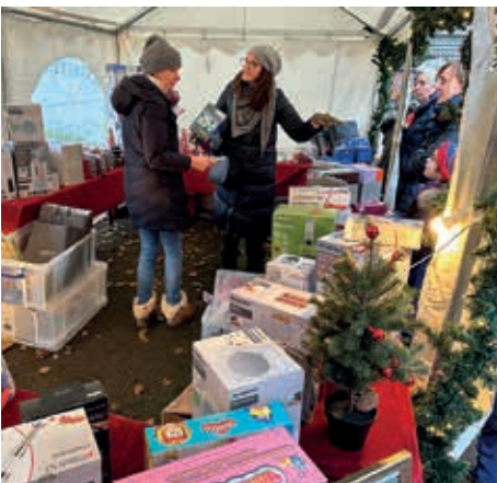
Der Stand der Benita Quadflieg Stiftung war natürlich auch gut besucht, weil alle neugierig auf den oder die Gewinne waren

Punkt 14.30 Uhr läuteten die Kirchenglocken den Beginn des Marktes ein. Es gab wieder die traditionelle Erbsensuppe der Freiwilligen Feuerwehr Nienstedten, Glühwein, Grillwürste, Waffeln und selbstgebackene Kekse für Karuco in Tansania. Bei Temperaturen um den Nullpunkt fand der Glühwein reißenden Absatz.