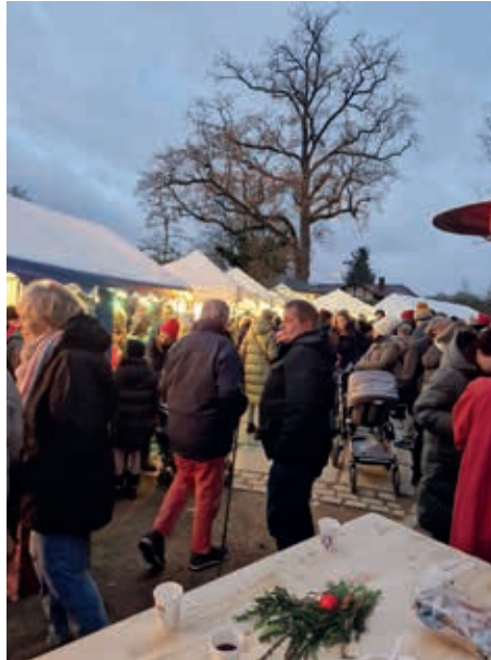
...und von Stunde zu Stunde wurde es immer voller

Aber nicht nur Essen und Trinken machen den Weihnachtsmarkt aus, sondern auch die Kunsthandwerkerstände und die jährliche Lotterie vom Haus Mignon, bei der wieder großartige Preise zu gewinnen waren.