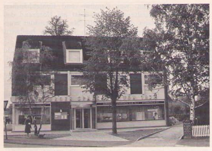
Der Neubau Nienstedtener Straße 2 anstelle des alten Bauernhauses Timm im Mai 1969

Geschäftshaus neugebaut. Das Erdgeschoß wurde im April 1969 durch die "Hamburger Sparcasse von 1827" jetzt "Hamburger Sparkasse" bezogen.