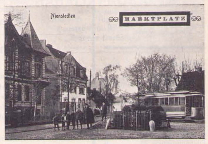
Nordende des Nienstedtener Marktplatzes ca. 1905: rechts das Dach des Hauses Timm

1967 wurde eins der Häuser des alten Nienstedten, von dem aus wohl, zur Gegenwart hin gesehen, am längsten Landwirtschaft betrieben wurde, abgerissen. Es war das Haus des Kleeberbur Timm, wie man im Dorf sagte. Das Bauernhaus Timm war für das Nordende unseres Nienstedtener Marktplatzes ein schöner Raumabschluß mit seinem großen Reetdach. Dies Nordende unseres Marktplatzes ist nun heute nur noch mit einem einzigen Zeugen aus alter Zeit geschmückt, mit jener Eiche auf der Verkehrsinsel, die mal eine Doppeleiche (zur Erinnerung an die Schleswig-Holsteinische Erhebung von 1848) werden sollte. Eine Postkarte der Zeit um 1905 zeigt diesen Verkehrspunkt mit der von 1899 bis 1921 verkehrenden Altona-Blankeneser Straßenbahn, der Gedenkeiche, den damals modernen Wohnbauten des Nienstedtener Maurermeisters und Bauunternehmers Peter Braasch und am rechten Rand das Dach des Bauernhauses Timm.